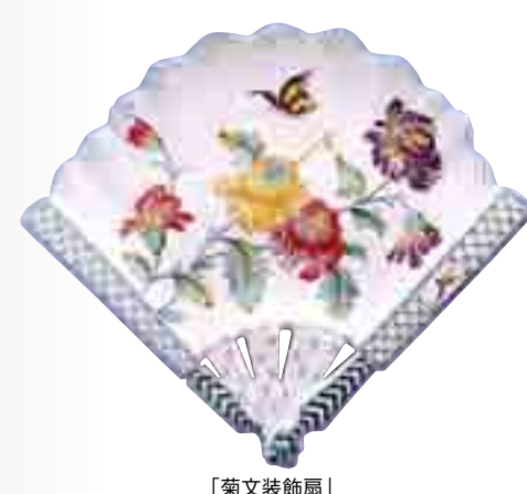
「菊文装飾扇」 エミール・ガレ