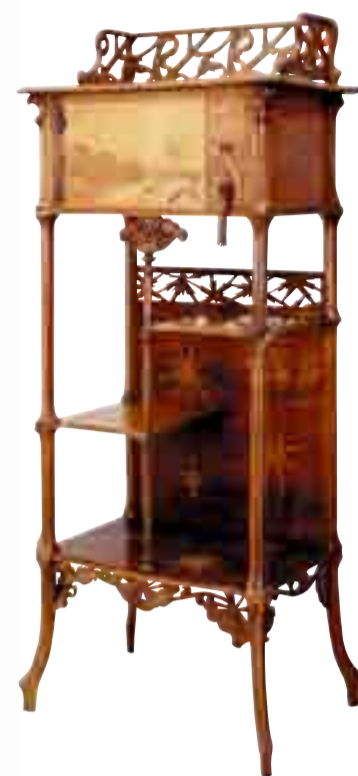
「織形花序文飾り棚」 エミール・ガレ