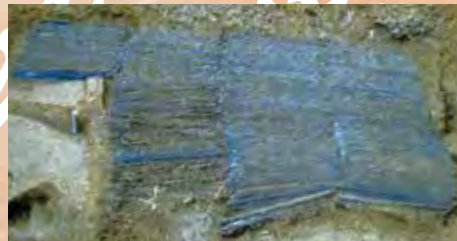
出土した358本の銅剣